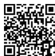
Vers la vidéo du produit