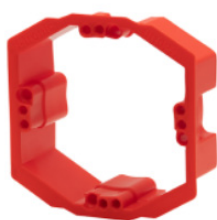
Compensateur de plâtre UI10PA