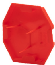
Couvercle de signalisation UI10SD